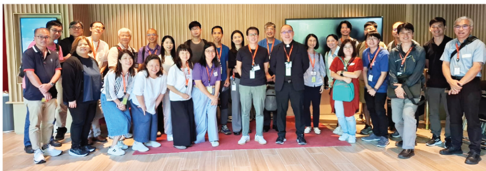
10月10日 屬靈導引工作坊