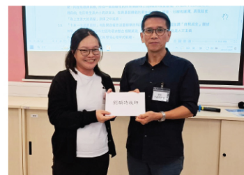
10月29-31日「事奉靈性培育營」