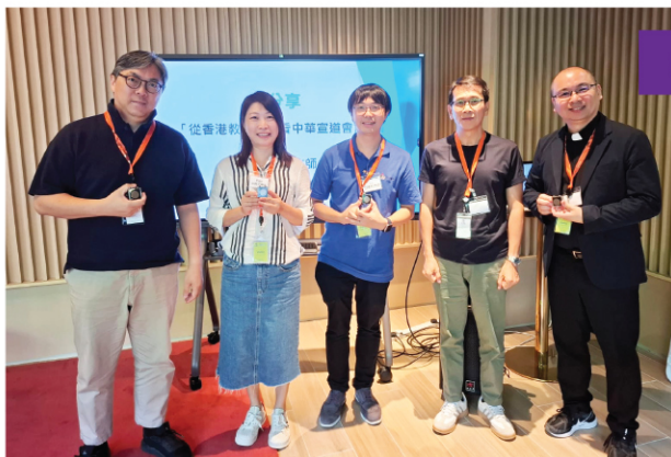
9月26日聯堂同工聚會